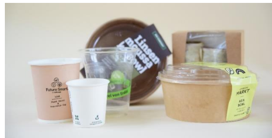
Abbildung 1. Wer Einwegplastik wie beschichtete Papp- oder Bioplastikverpackungen für die Bereitstellung von Essen und Trinken verwendet, muss künftig auch Mehrwegalternativen anbieten.

Dabei ist unerheblich, ob die Behältnisse ganz oder teilweise aus Kunststoff bestehen. Auch wenn nur die Beschichtung Kunststoff enthält, fällt ein Behältnis unter die neuen Regelungen. Irrelevant ist ebenfalls, ob es sich um soge-