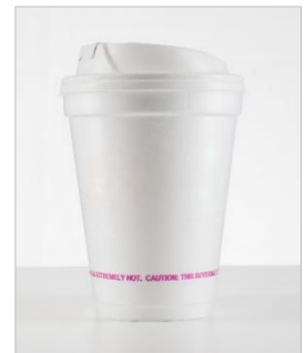
Ab 3.7.2021 verboten: Einwegbecher aus aufgeschäumtem Polystyrol

Allerdings sieht Artikel 4 der zugrundeliegenden EU-Richtlinie 2019/904 eine „ehrgeizige und deutliche Verminderung des Verbrauchs“ aller Einweggetränkebecher vor. Die Bundesregierung hat auf diese Vorgabe mit einer Änderung des Verpackungsgesetzes reagiert, die vorsieht, dass alle Betriebe, die Einwegbecher zur Bereitstellung von Getränken im Außer-Haus-Konsum nutzen, ab dem 1.1.2023 ebenfalls die Mitnahme in Mehrwegbechern anbieten müssen.